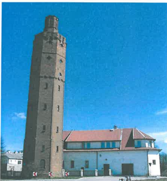
Jednym z najważniejszych zabytków architektury i budownictwa Białej Piskiej jest wodocłagowa wieża cziśnień, której wysokość sięga 34 metrów a za rok budowy uważa się datę 1928 r. W najbliższych latach planowane jest uruchomienie tarasu widokowego na budynku wieży, który byłby jedną z wielu atrakcji miasta.