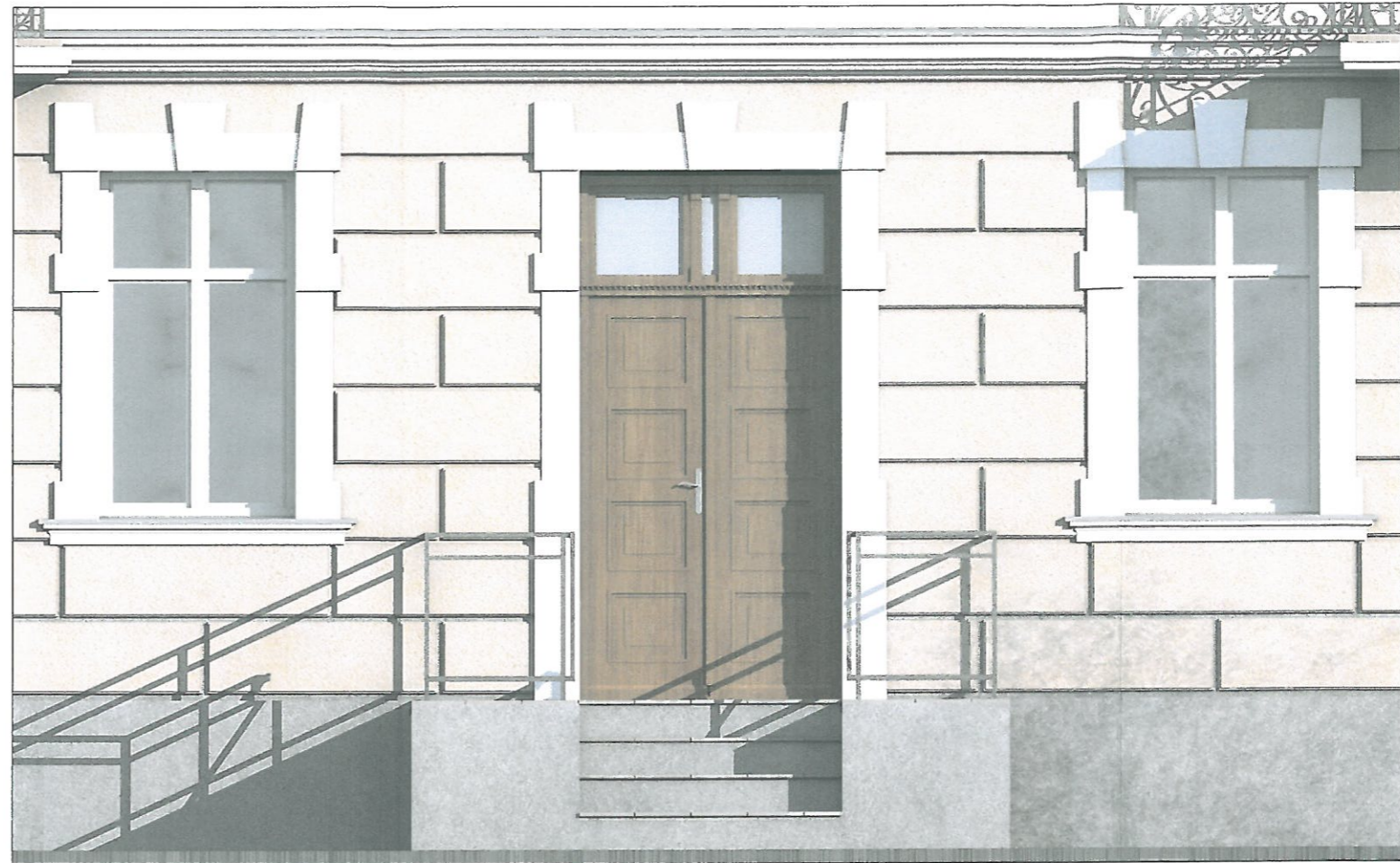
DRZWI WEWNĘTRZNE WAHADŁOWE materiał: drewno dębowe, szkło matowe hartowane