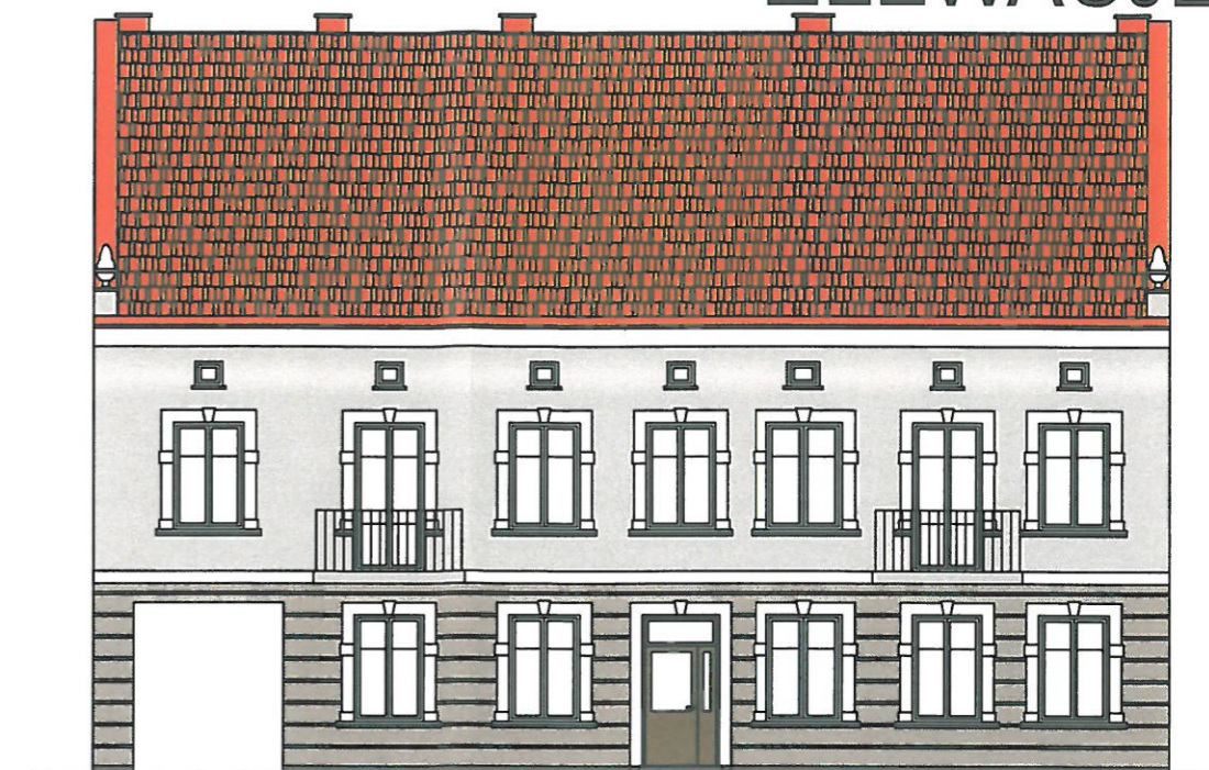
ELEWACJA FRONTOWA - MALOWANIE FARBĄ NA SPOIWIE SILIKONOWYM