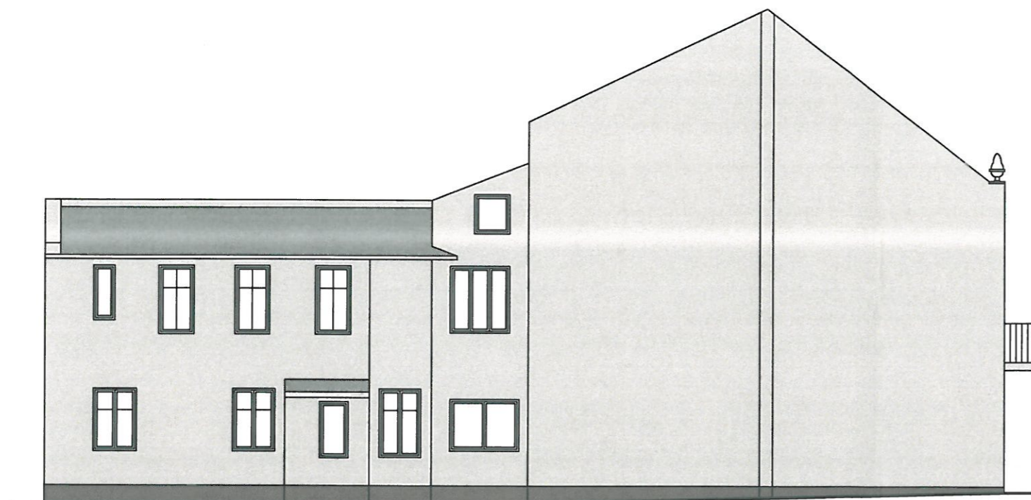
DOCIEPLENIE ŚCIANY STYROPIAN GRAFITOWY GR 10 CM , TYNK SILIKATOWO SILIKONOWY